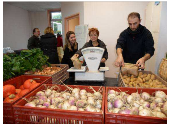
Distribution AMAP des 2 vallées – octobre 2012

L'AMAP souhaite approfondir son rapprochement avec une structure d'insertion sociale pour des femmes en difficultés. Un travail sur les recettes de cuisine sera proposé mais aussi des ateliers-cuisine avec des produits des producteurs de l'AMAP pour créer du lien entre l'AMAP et les femmes en difficultés.