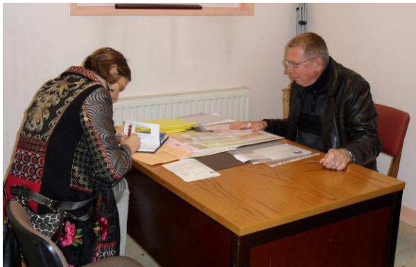
Renouvellement des contrats AMAP des deux vallées - octobre 2012

Présentez votre AMAP dans le prochain numéro ! Contactez nous : famapp@amap-picardie.org