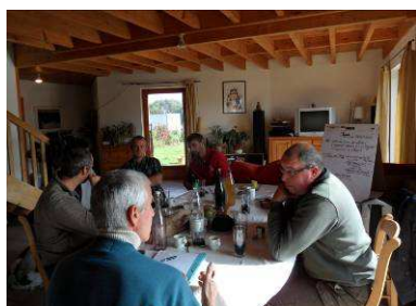
Rencontre maraîchers en AMAP – 9 octobre 2012