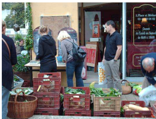
Distrib Creil-Eté 2009-LR