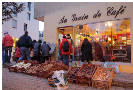
Distrib Creil -Hiver 2010-JP Bertrand

Enfin, le groupe a tout récemment créé une « AMAPthèque », le principe étant de récupérer des DVD et des livres sur la question alimentaire et agricole par des dons, et de faire des prêts auprès des adhérents au sein de l'association.