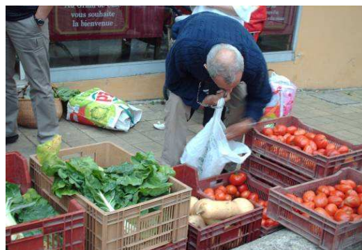
Distrib Creil-Eté 2009-LR